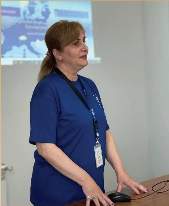
მესტიის მუნიციპალიტეტის ადგილობრივი თვითმმართველობის სააქტო დარბაზში გაიმართა შეხვედრა, მიგრაციის საერთაშორისო ორგანიზაცია (IOM) მიერ. შეხვედრის თემა გახლ-

დატ „ინფორმირებული და კანონიერი მიგრაციის მხარდაჭერა“.