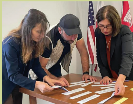
საქართველოს ახალგაზრდა იურისტთა ასოციაციის წევრების

ფილმმა მყურებლის დიდი მონონება და მქუხარე აპლოდისმენტები დაიმსახურა.