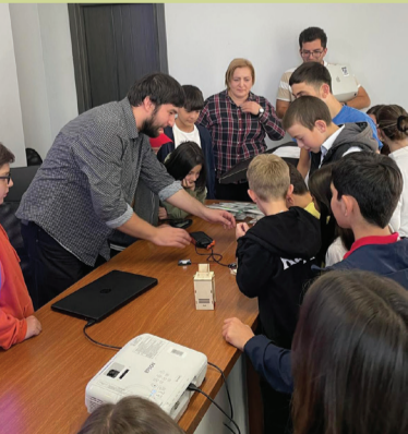
მოსწავლეები და ახალგაზრდები. დამსწრეებს საშუალება ჰქონდათ გაცნობოდნენ თანამედროვე მეცნიერებისა და ტექნოლოგიების მიღწევებს STEAM-ის სამყაროში.

პროექტი განხორციელდა ნოვაციების და ტექნოლოგიების სააგენტოს ინიციატივით, კომპანია ქლევერტონის მიერ.