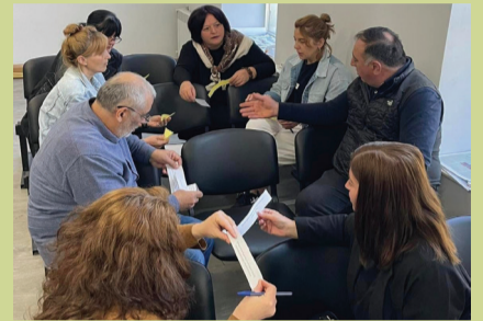
რეგლამენტში ცვლილებების შეტანა.

ტრენინგის მიზანია სახელმძღვანელო შესაძლებლობების გაძლიერება და ამ მიზნით საკრებულოს