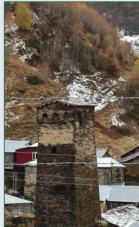
ცემული სამუშაოების მწვავე საჭიროება 2021 წლის ივლისში კულტურის, სპორტისა და ახალგაზრდობის

მინისტრის თეა წულუკიანის სვანეთში გამართული სამუშაო ვიზიტისას გამოიკვეთა. სტუმრობისას მინისტრი ადგილზე გაეცნო იუნესკოს ნუსხაში შეტანილი კულტურული მემკვიდრეობის ძეგლების მდგომარეობასა და მაცხოვრებელთა პოზიციაც მოისმინა. მინისტრი მოსახლეობას დაჰპირდა, რომ უშგულის თემში შექმნილი პრობლემების აღმოსაფხვრელად სამინისტრო აუცილებლად იმოქმედებდა.